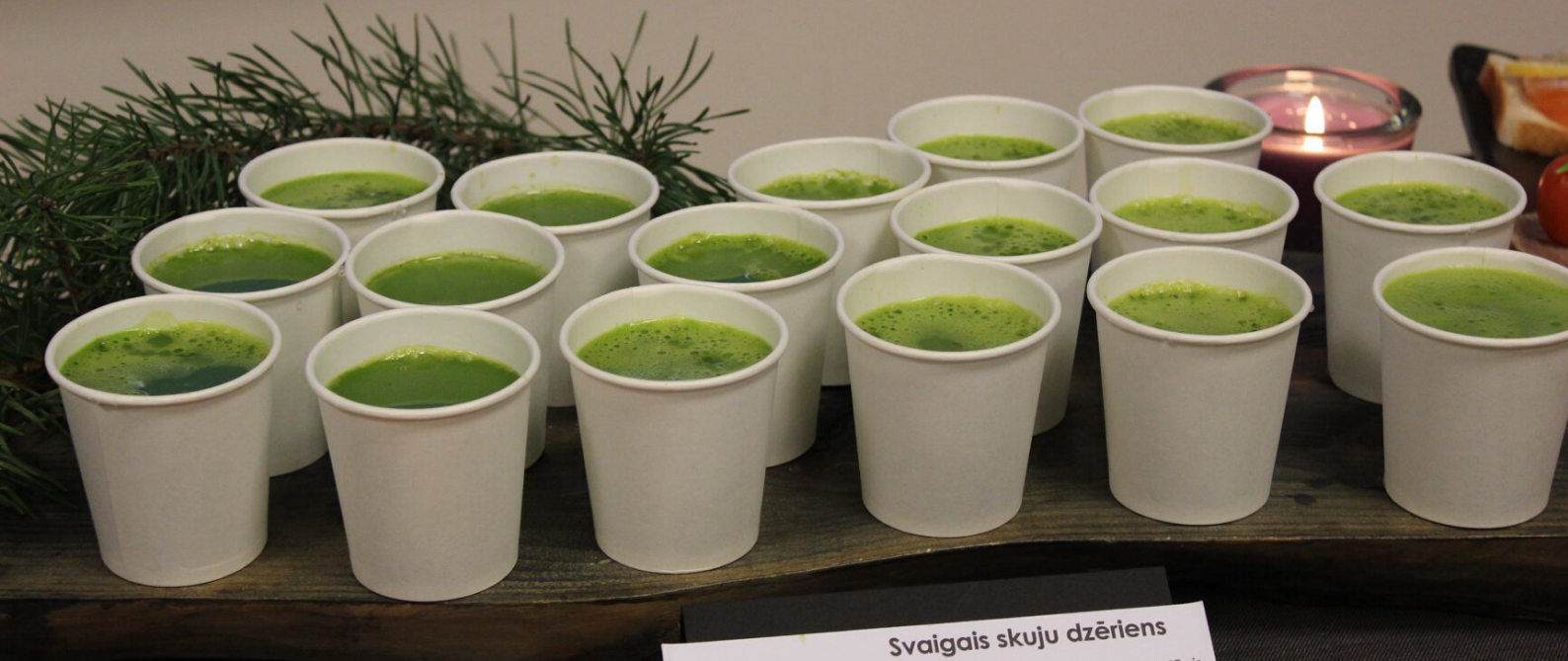
Svaigais skuju dzēriens