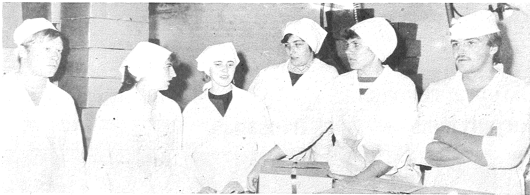
Nadeždas Jakimovas maiņa