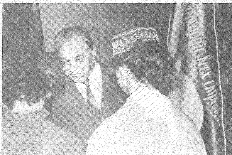
Par panākumiem sociālistiskajā sacensībā šā gada trešajā ceturksnī agrofirmas kolhoza «Krasnij Oktjabrj» apbalvots ar Latvijas KP ra-