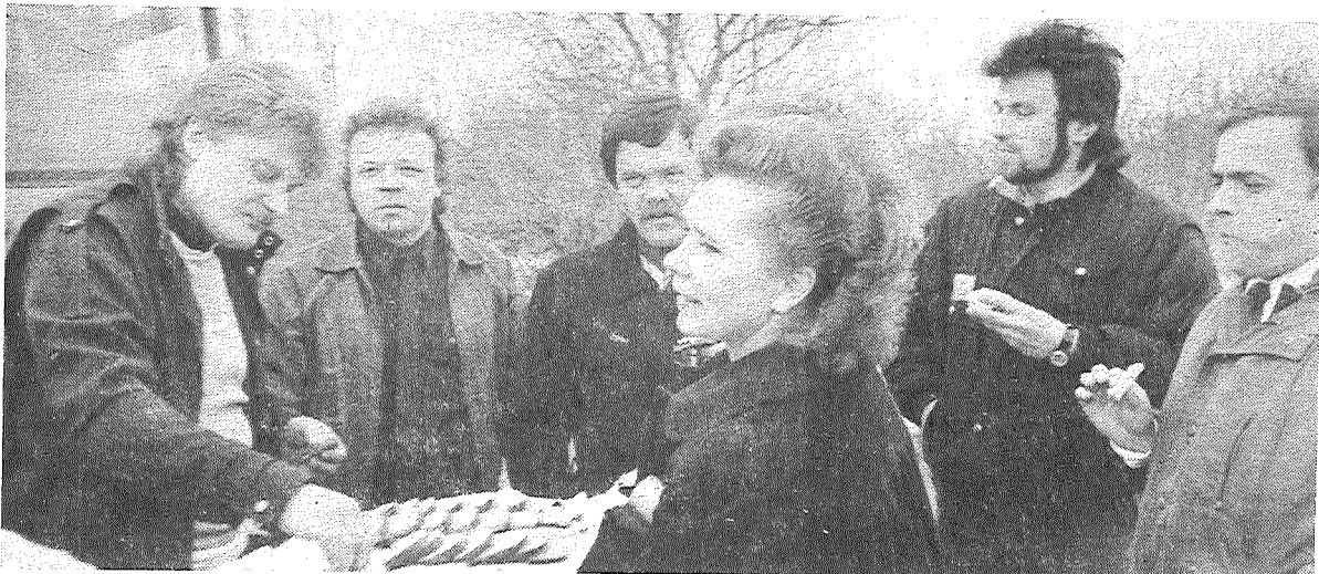
Attēlā: viesu sagaidīšana.

Bez priekšējās četras grupas devās uz Preiļiem un Līvāniem, Aglonu un Galēniem.