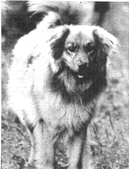
Vasals! Kū pasaceisil!