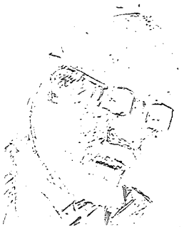
A. MEZMAĻĀ draudzīgais saržs.

Jāatzīstas, mazliet baidījos, vai Streičs ieturējis šajā materiālā, viņš taču to nezina tā, kā mēs, kara dalībnieki. Un jaunās aktrises, kas vispār izaugušas citā laikā, — vai viņas mūs, sapratīs? Taču manas bažas izrādījās nepamatotas. Režisoram izdevies radīt ļoti patiesu tā laika atmosfēru, visas meitenes spoži izpilda savas lomas. Streičs ļoti daudz darījis, lai filmā (Nobeigums 4. lpp.)