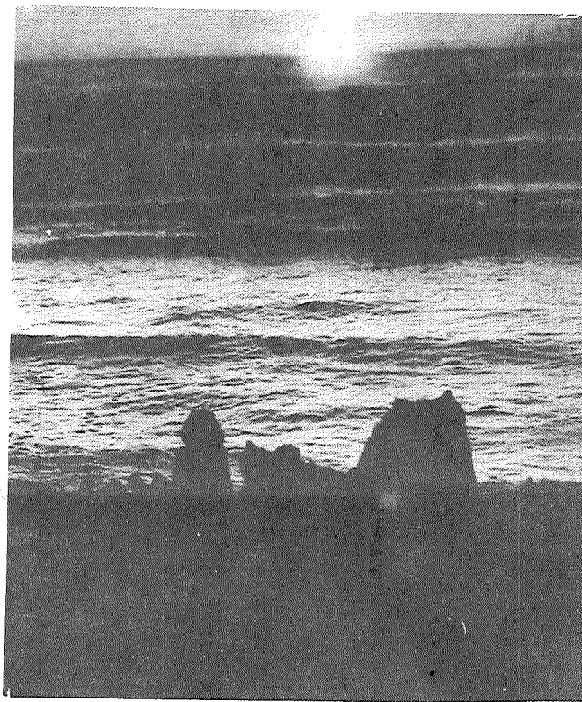
Aiziet saule jūriņā, Sēž zelta laiviņā...

vošanos, vairums kalpotāju noslēpās kur kurais prazdams, bet Kalistratovs, «notvēris» palikušos, sāka «ievieš kārtību». Turpinājums sekos