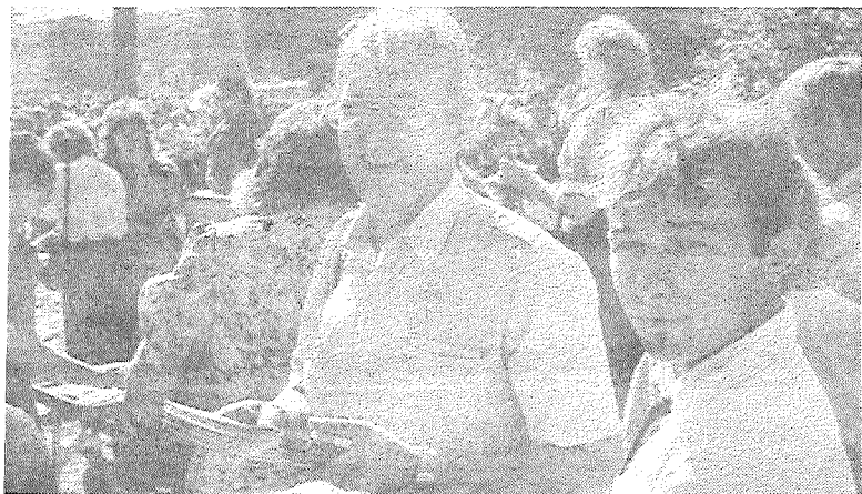
Nasen Rēzeknes rajona Saksītagola «Koln-sān», kur ir pazeistamo Latgolas atmiņas dar-binīka F. Trasuna gimines mōjas pamādas stō-vūktī, atklēts piņinas krysis. Pīnā sporā tī gatavōjōnōs šū āku komplektai restaurācijai, lai pē: tam le varātu tkōrtōt memorialu mōju. Aftālā: jau vosorā sō:es leidzekļu vōkšona Trasunu mōjas rekonstrukcijai.