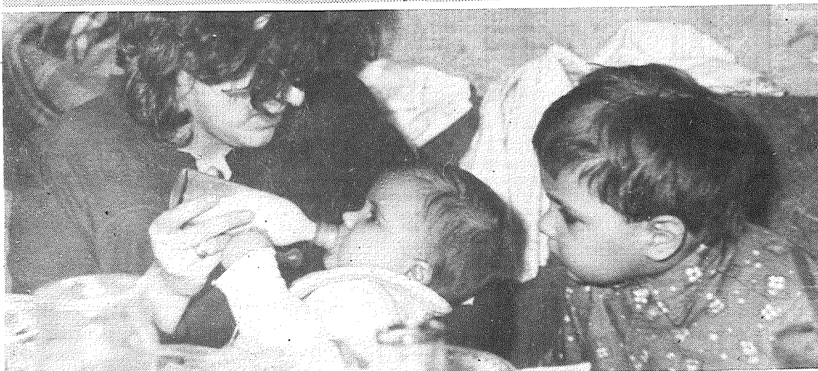
Вкусно ли сестренке?