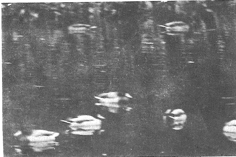
Отдых с далекого пути.