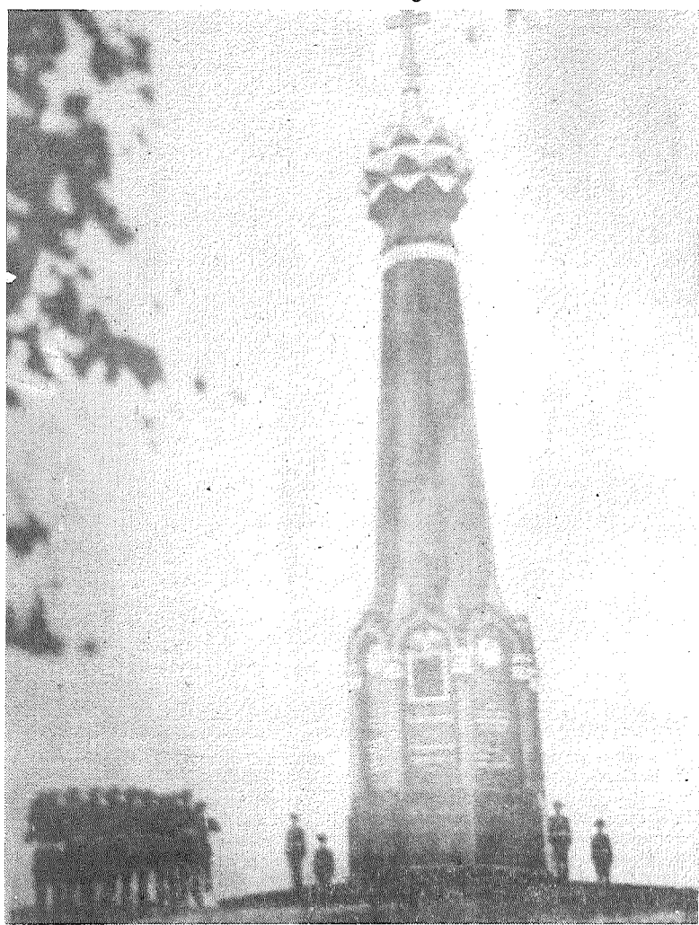
Таким теперь выглядит главный монумент Бородинской битвы, открытый во время юбилейного праздника 6 сентября [о строительстве его писали в газете от 25 июля].