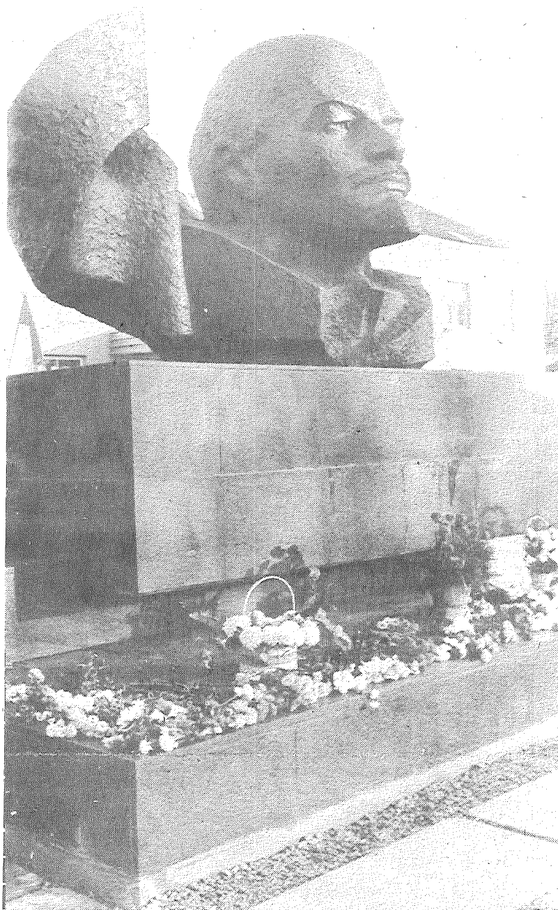
Накануне праздника Великого Октября в административном центре города Преиля открыт памятник вождю пролетариата, создателю Коммунистической партии и первого в мире социалистического государства Владимиру Ильичу Ленину (2-я страница).

Актуальность сегодняшнего дня — максимальная мобилизация сил.