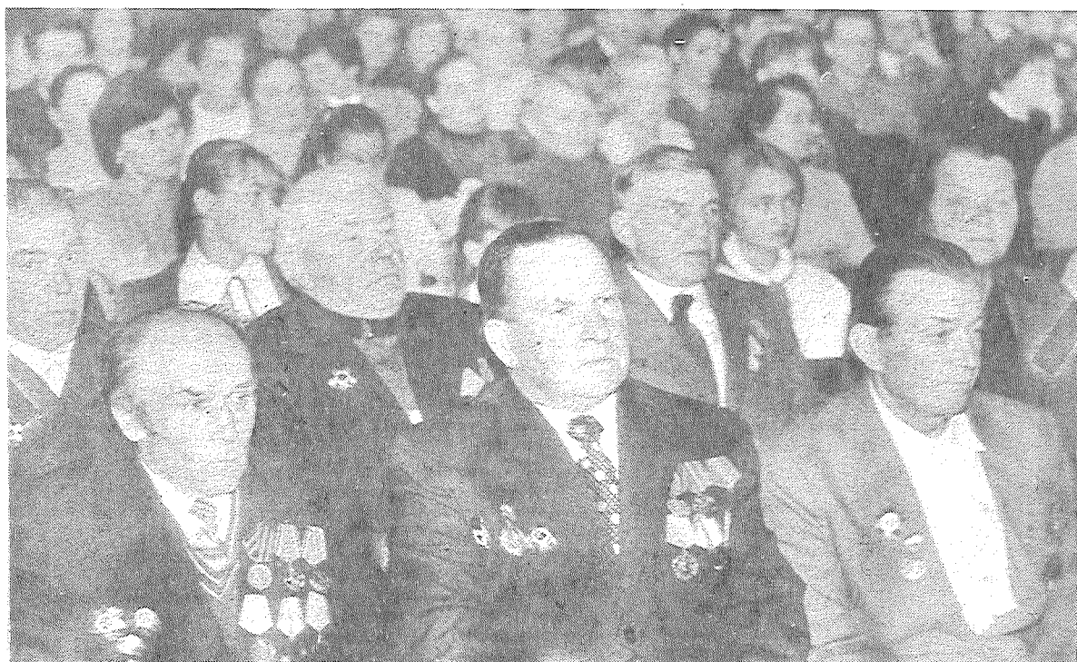
Шестидесять лет тому назад глашатай революции поэт Владимир Маяковский в поэме «Хорошо!»

свою советскую Родину назвал подростком и со всей силой своего громадного таланта воскликнул: