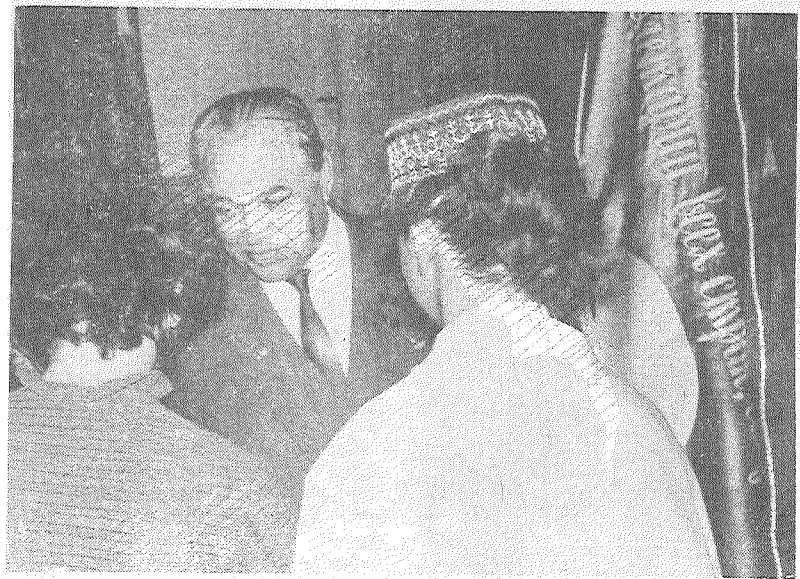
За успехи, достигнутые в социалистическом соревновании за третий квартал коллектива колхоза «Красный Октябрь» удостоен пере-