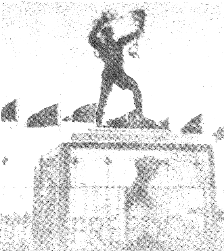
Памятник «Свобода» в Лусаке

Считают, что в Лусаке в настоящее время проживает более