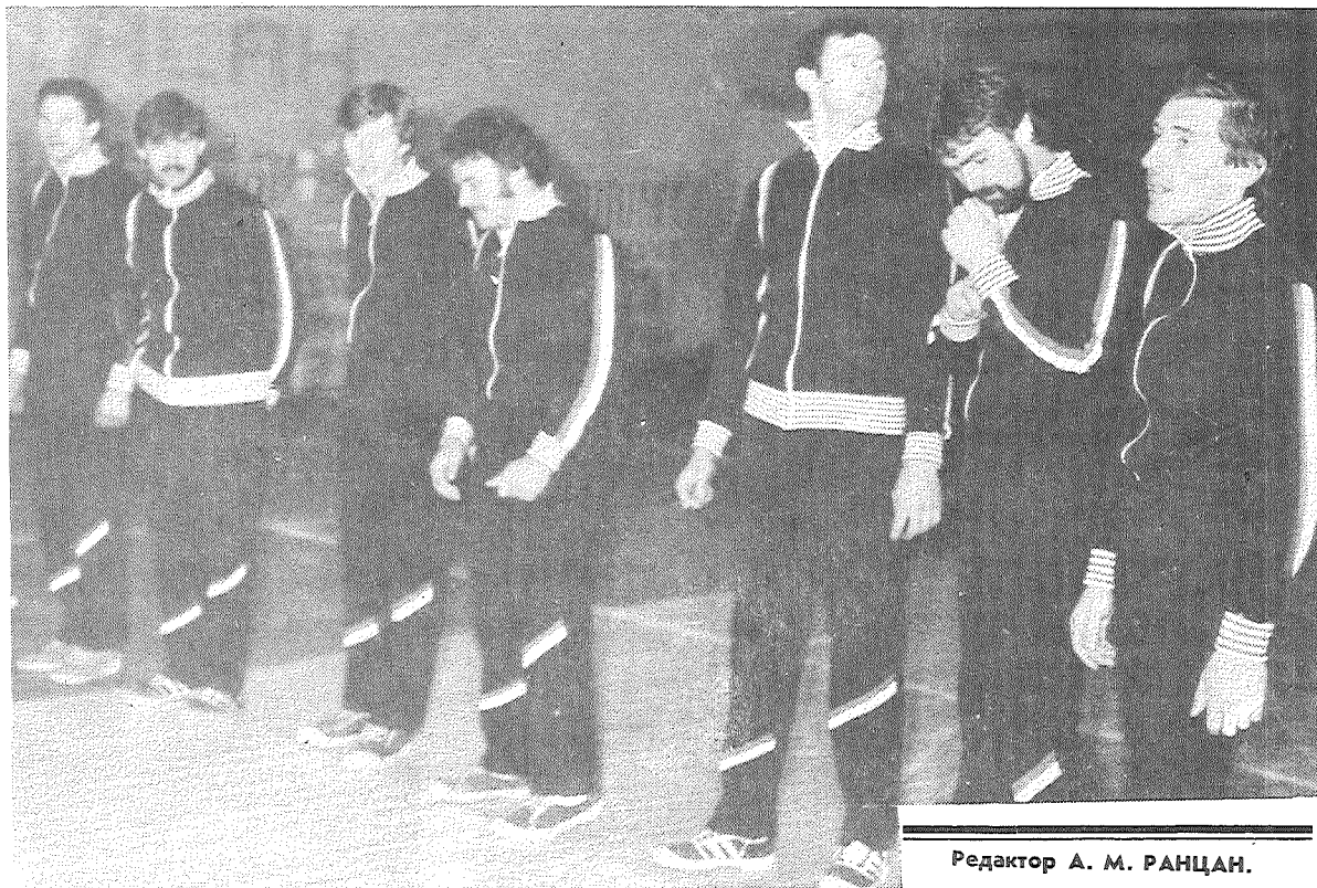
Редактор А. М. РАНЦАН.