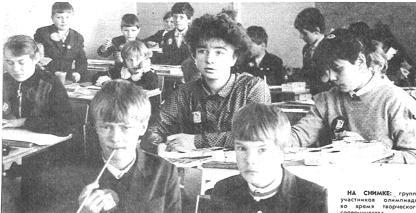
НА СНИМКЕ: группа участников олимпиады во время творческого соперничества.