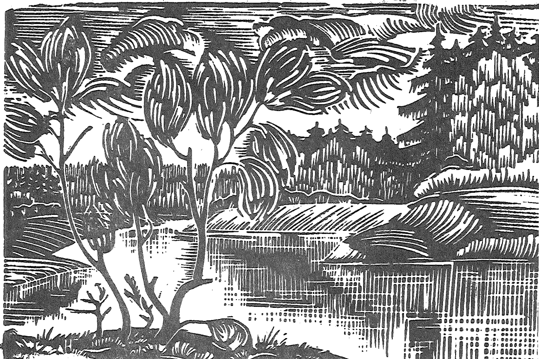
Линографюра Николая Горкина.

Учитывая, что в наших магазинах пуговицы в довольно большом ассортименте, то те, кто послушаются совета этого популярного издания, смогут произвести впечатление.