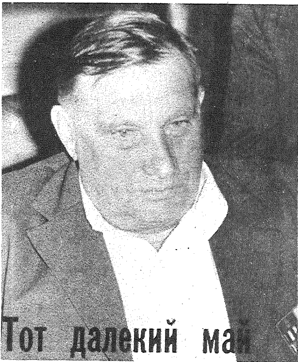
Тот далекий май

В чем-то человек — как дерево: ему тоже нужны корни. Есть, говорят, в степи растения без корней, зовут их — перекасти-поле. Может быть, это и удобная форма выживания в суровых условиях.