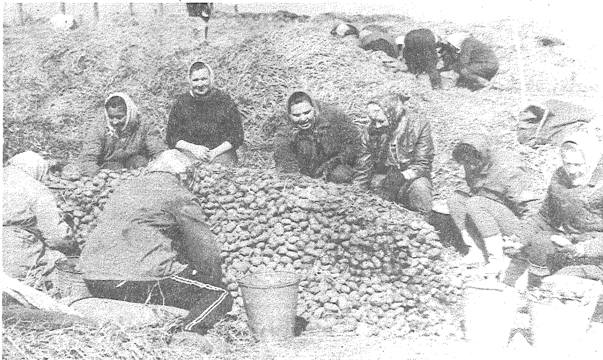
В дни подготовки к весенне-полевые работы много хлопот доставляла переборка семенного картофеля. Ввиду сложных погодных условий в прошлом году были подозрения, что они плохо перезимуют в буртах. При вскрытии их оказалось, что положение не такое критическое. Все же колхозницам нужна была помощь толочан. Но и они сами работали проворно (на снимке).

Пустые дни: в мае — 8, 9, 10, 11, 12, 16, 21, 22, 23, 24, 25, 26, 27, 29, 30 в июне — 1, 2, 3, 4, 5, 6, 8, 9, 10