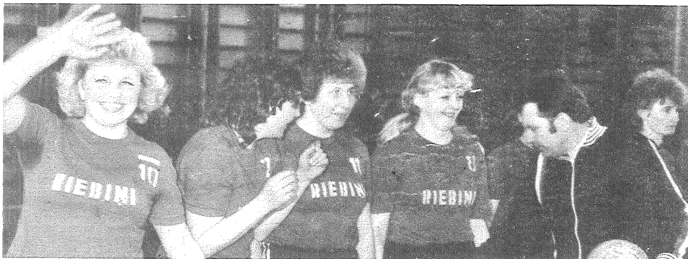
На снимке: команда женщин агрофирмы «Красный Октябрь» после победы.