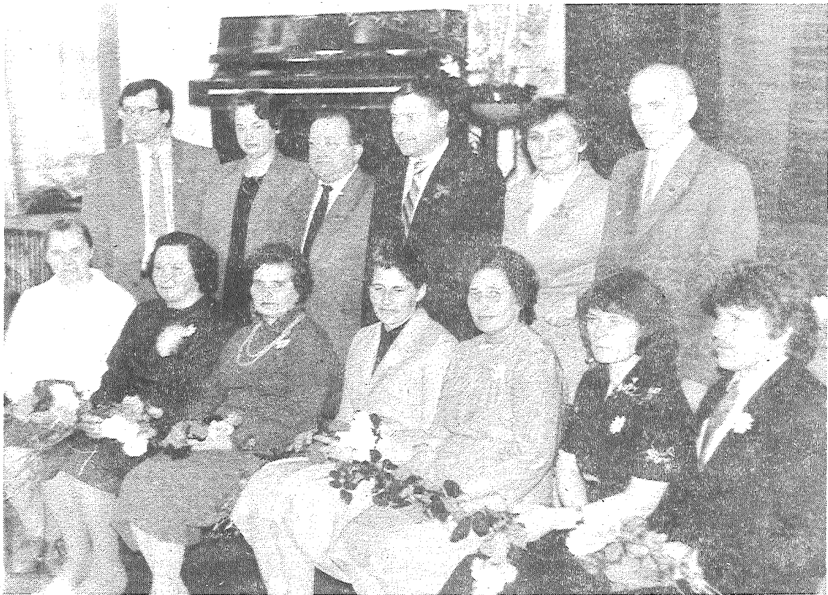
Начало на 1 стр.

будут записаны те, кто проработал по своей специальности не менее 20 лет и надаивают свыше 5000 кг молока от каждой коровы латвийской бурой породы, 6000 кг — от черно-пестрой и 6500 кг молока от каждой импортной черно-пестрой коровы.