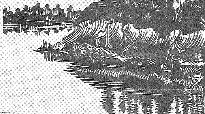
Линогравюра Николая Горкина