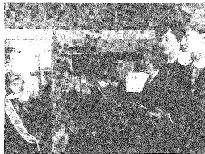
НА СНИМКАХ: школьная пионерская организация пополнилась новыми пионерами; ученики 3а класса на Празднике красного галстука; прощание с пионерской организацией в 8 классе; октябристы 2б класса — смелые пионеры.