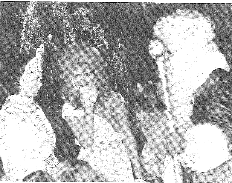
НА СНИМКАХ: самые популярные участники Новогодней елки. Веселый хоровод вокруг елки.