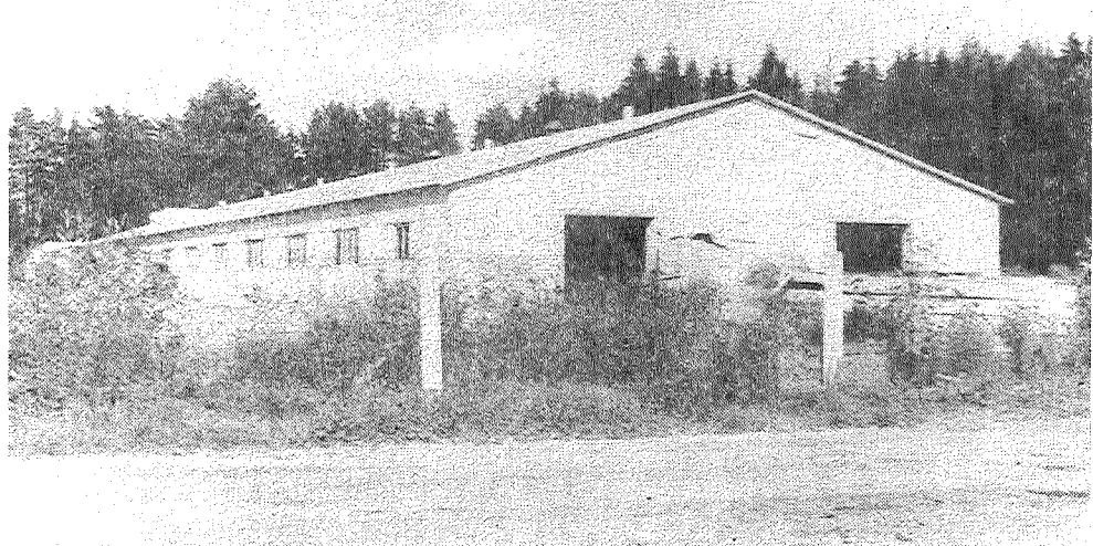
На снимке: еще один образец сделанного строителями — новый корпус на свиноводческом комплексе «Айзупиеша» в зоне, которая экологически чиста.