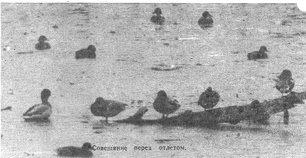
Совещание перед отлетом.

Жаль, лето уходит. Главное, весь урожай собрать в хранилища.