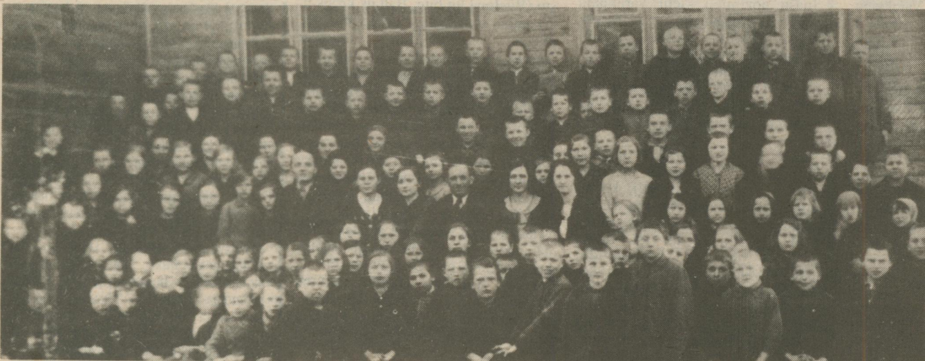
S. H. C. 2.1873. KUBSĒJA RINDA. AVIORS