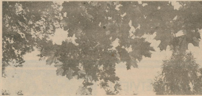
RUDENS JAU SĀRTOJA KĻAVAS