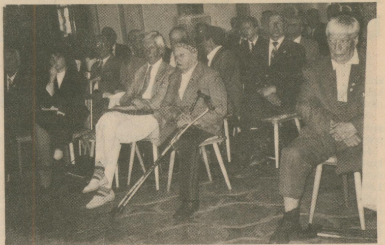
Alberta Spoga foto