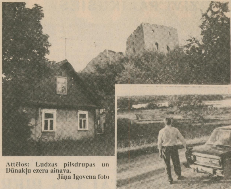
Attēlos: Ludzas pilsdrupas un Dūnaku ezera ainava.