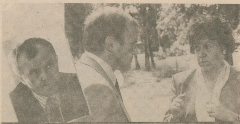
Preiļos viesojās savienības «Latvijas ceļš» iekšlietu ministrs Jānis Adamsons un valsts ministre Aija Poča.

dzimis 1956. gada 3. novembrī Preiļu rajonā, latvietis, absolvējis Kijevas augstāko jūras kara skolu, civilā specialitāte – tālbraucējs stūrmanis, militārā – kara flotes virsnieks. LR iekšlietu ministrs, precējies, meita, bijis PSKP biedrs, Hobijs – burāšana, brīvajā laikā lasa grāmatas un apmeklē teātri. Cilvēkos visaugstāk vērtē godīgumu, taisnīgumu un principialitāti, necieš divkosību un lišķību, par labāko īpašību atzīst godīgumu pret sevi un citiem, sliktāko – ne vienmēr kontrolē emocijas.