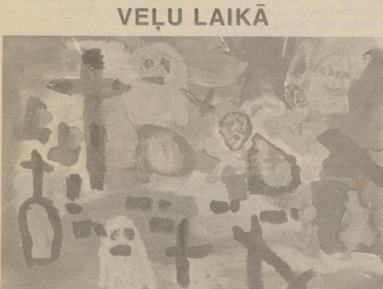
Zim. Jānis Rancāns

– Paldies par atbildēm un vēlām jaunus panākumus turpmākajā ražīgajā darbā!