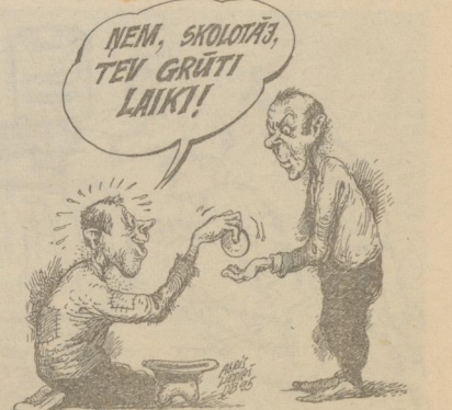
Agris Liepiņš «Dienas Biznesa» karikatūru nodaļa

Valdība iecerējusi samazināt budžeta līdzekļus Izglītības ministrijai. Skolotājiem zūd cerība saņemt algas pielikumu. «Dar' man tēvis pastaiņās...»