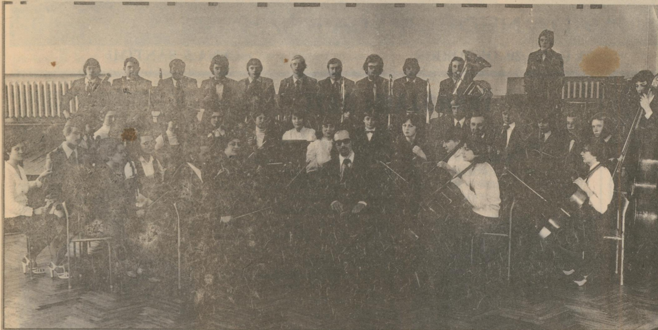
Rēzeknes mūzikas koledžas simfoniskais orķestris