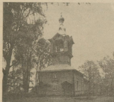
Rēzekne, I. Siņicina ielā 4, celts

1906. gadā, vec ticībnieku kopu draudzes īpašums. Koka, halles tipa tainstūra garenplāna kulta celtnē ar akcentētu apjomā 2 stāvu priekšapjomu, virs kura paceļas masīvs zvana tornis, vainagots ar piramidālo jumtiņu un sīpolveidīgo kupoliņu. Baznīcas tornī atrodas kādreiz reģionā lielākais zvans, draudzei pieder 17. – 18. gs. reto grāmatu un liela 19. – 20. gs. sākuma svētbilžu kolekcija.