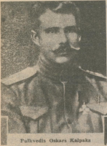
Pulkvedis Oskars Kalpaks