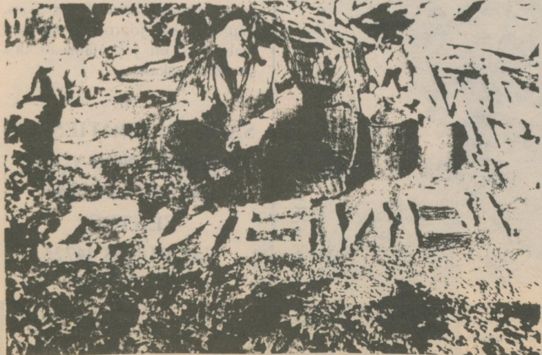
RAKSTA AUTORS 1952. GADĀ