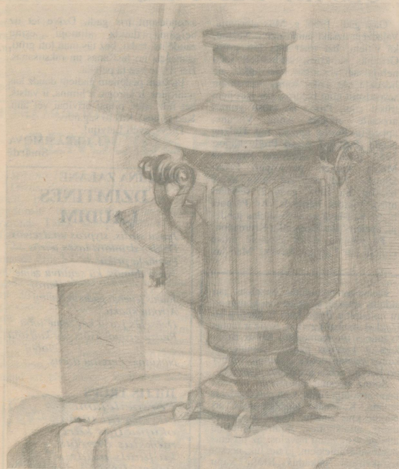
R. LAZDIŅA zīm.