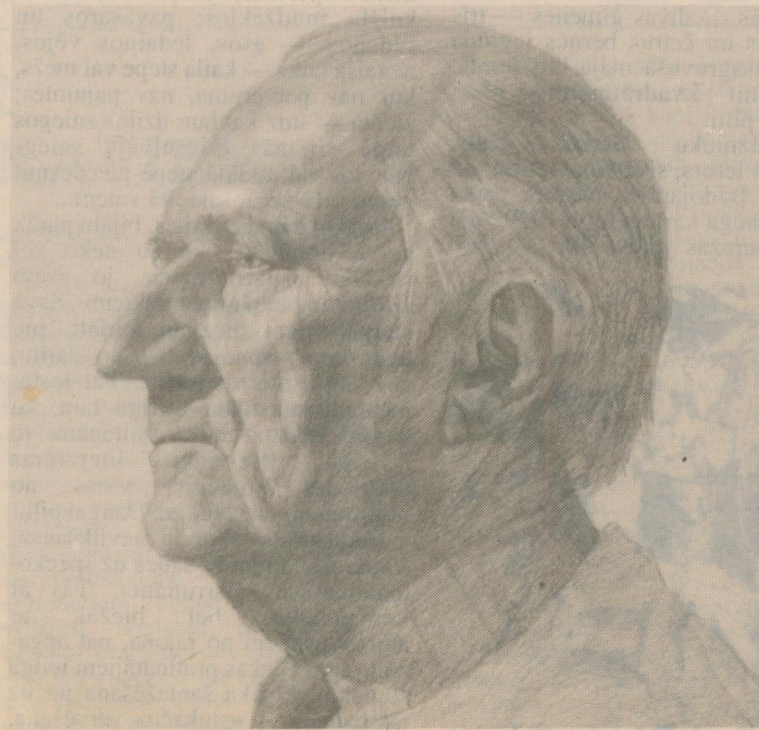
A. BUTNORA zīm.

Attēlos: konkursa emblēma un nozīmīte; zīmēšanas konkursa uzdevumu veiksmīgākie risinājumi.