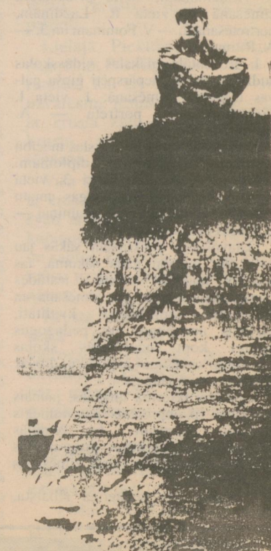
UZ IRTIŠAS KRASTA