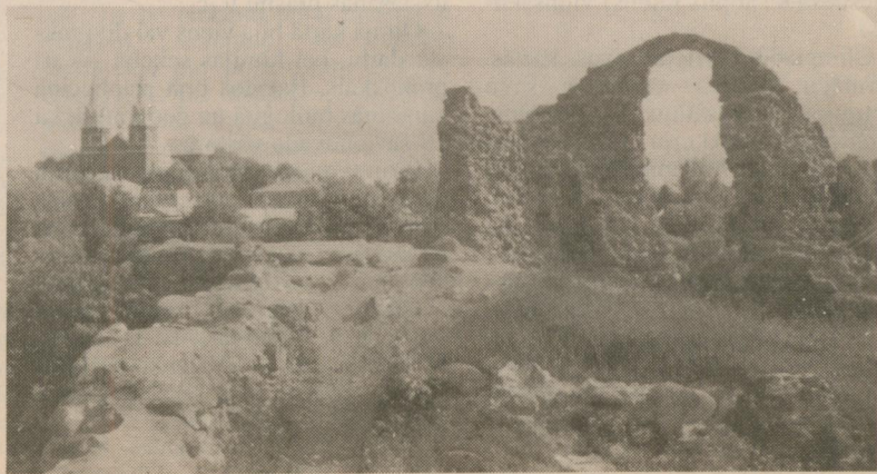
SKATS NO RĒZKES PILSKALNA UZ KATEDRĀLI

Ar cerību uz aktīvu sadarbību. Un neaizmirsīsim, ka kuplās ģimenes ir mūsu tautas lepnums.