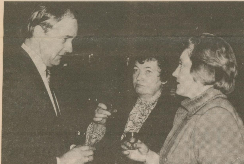
no notikuma vietas.