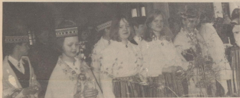
Attēlā: noskaņa Dievnāmā.

○ Atgūtajā Rēzeknes luterāņu baznīcā notika pirmie kristīšanas un iesvētīšanas svētki, tuvāk par to — 2. lappusē.