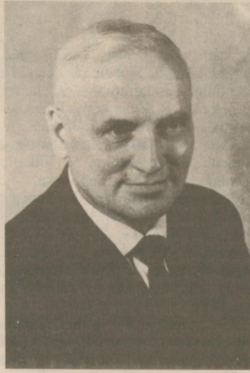
V. LŌCIS — IZDEVĒJS

Trīsdesmito gadu beigās abi jaunieši nolemj dibināt izdevniecību.