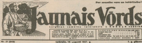
Latvijas Saeimas izdevums Nr. 24 (69) Nr. 31 (248) Ceturtdiņa, 19. augustā 1997. g. 7. p. gājums

Francisks Simons (1842—1918), kurs labi prota latviski. * 1786. goda 27. jūnijā Krōslovas īpašņiks pulkvedis grafs Augusts Plāters nūslēdze leigumu ar veiskupu Benislavski, pasajēme nu Krōslovas muižas īnōkumim izmoksōt bezneickungim misionarim draudzes školās uzturēšonai pi Krōslovas klūstera pa 180 rubļu godā. * 1931. goda 2. jūlijā sōce iznōkt Latgolas zemņiku un inteligences laikroksts «Jaunais Vārds». * 4. jūlijā 70 godu jubileja veiskupam Jōņam Cakulam. 1926. godā dzimis Rudzātu draudzē, gondreiž vysu prīstereibas dorbu vadējis Reigas sv. Marijas Magdalenas draudzē.