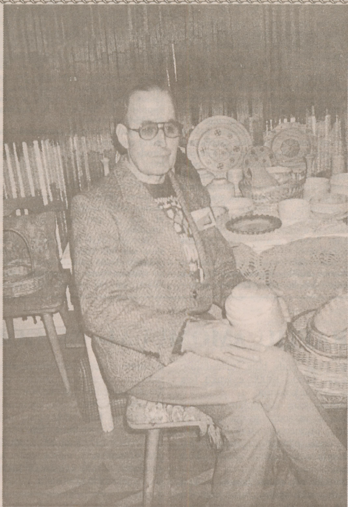
PREIĻŪS PLAŠI PAZEISTAMS AIZKAĻNES POGOŠTA DAIĻOMOTA MEISTARS J. ĢEIDA. JYS PASTOVĒIGI PĪSADOLA AMATNĪKU BĪDREIBAS REIKĒTĀJŪS PASĒKUMŪS

Adrese: Rēzeknes rajons, Bēržgale, Rītupes ilā 34, LV-4612, tālruni: direktorei — 25320, sekretarei — 90494, grōmatvedeibai — 90517.