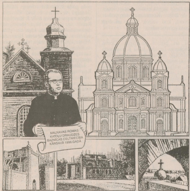
MALNOVAS ROMAS KATŌĻU DRAUDZES BAZNĪCAS CEĻNĪCĪBA KĀRSAVĀ 1996. GADĀ