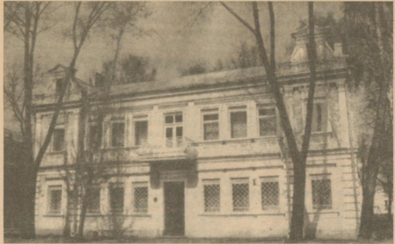
KRĪVU KULTURAS CENTRS DAUGAVPILĪ