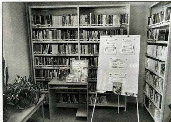
Bibliotēkā pieejama sēklu apmaiņas kaste, kurā katrs var ielikt savas sēklas un atrast sev nepieciešamās.