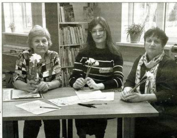
Žūrija. Klausīties un vērtēt skolēnu sniegumu ir atbildīgs uzdevums, jo, atšķirībā no parasta klausītāja, ir jābūt maksimāli objektīvam.